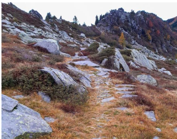
Mulattiera selciata all'ingresso della Bocchetta

Il sentiero è inserito nell'inventario delle vie di comunicazione storiche della Svizzera come percorso GR 3110 ed è classificato come oggetto di importanza regionale. In futuro la sua importanza potrebbe essere rivalutata come d'importanza nazionale. Del resto, l'Ufficio federale delle strade (USTRA), nella sua decisione del 23 ottobre 2023, riconosce per l'opera il sussidio massimo, come se essa avesse una importanza nazionale.