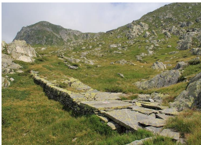
Percorso in zona Cugn